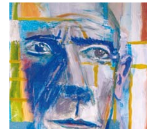
» Jürgen Spindler Niederkrüchten, Malerei