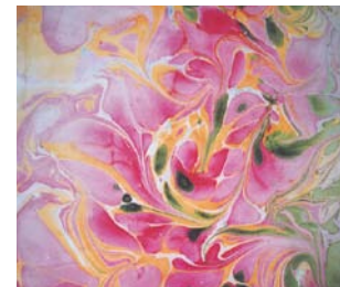
» Veronica Spindler-Schilde Niederkrüchten, Seidenmalerei