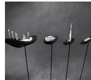
» Sylvia Kopka Wuppertal, Glasgestaltung