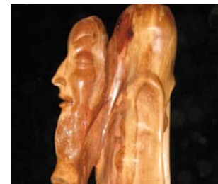
» Pasquale Lo Tufo Meerbusch, Bildhauerei, Grafik und Möbeldesign