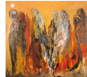
» Hedi El Abed Ratingen und Port El Kantaoui/Tunesien, Malerei