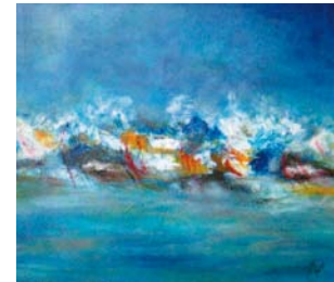
» Najet El Abed Port El Kantaoui/Tunesien, Malerei